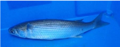
船に飛び込んできたボラ君

絶好の秋日和。波静かで、船のまわりでたくさんのボラが跳ね回っていました。船の「魚探」は、ボラを感知しピッピッと鳴りずめ。元気のいいボラ君が我らの船の中に飛び込んできました。