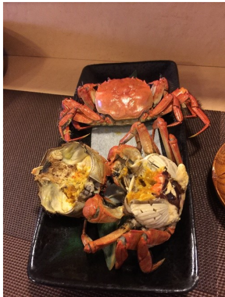
モクズガニ メスとオスの食べ比べ