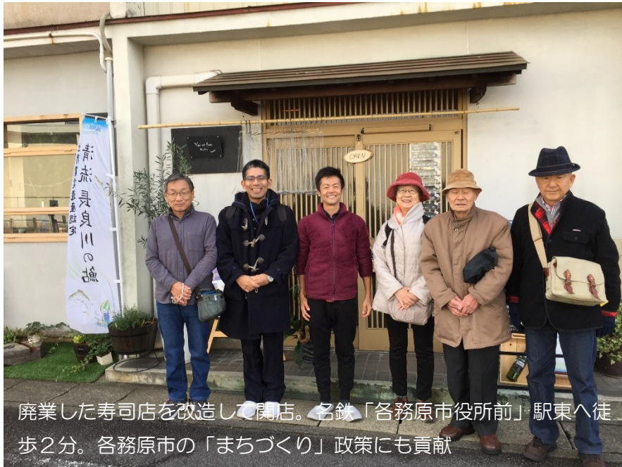
廃業した寿司店を改造して開店。名鉄「各務原市役所前」駅東へ徒歩2分。各務原市の「まちづくり」政策にも貢献