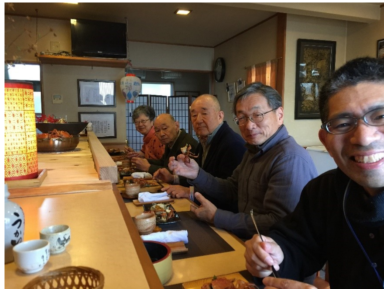
酒があつてのモクズガニ！今日は最高！極楽・極楽